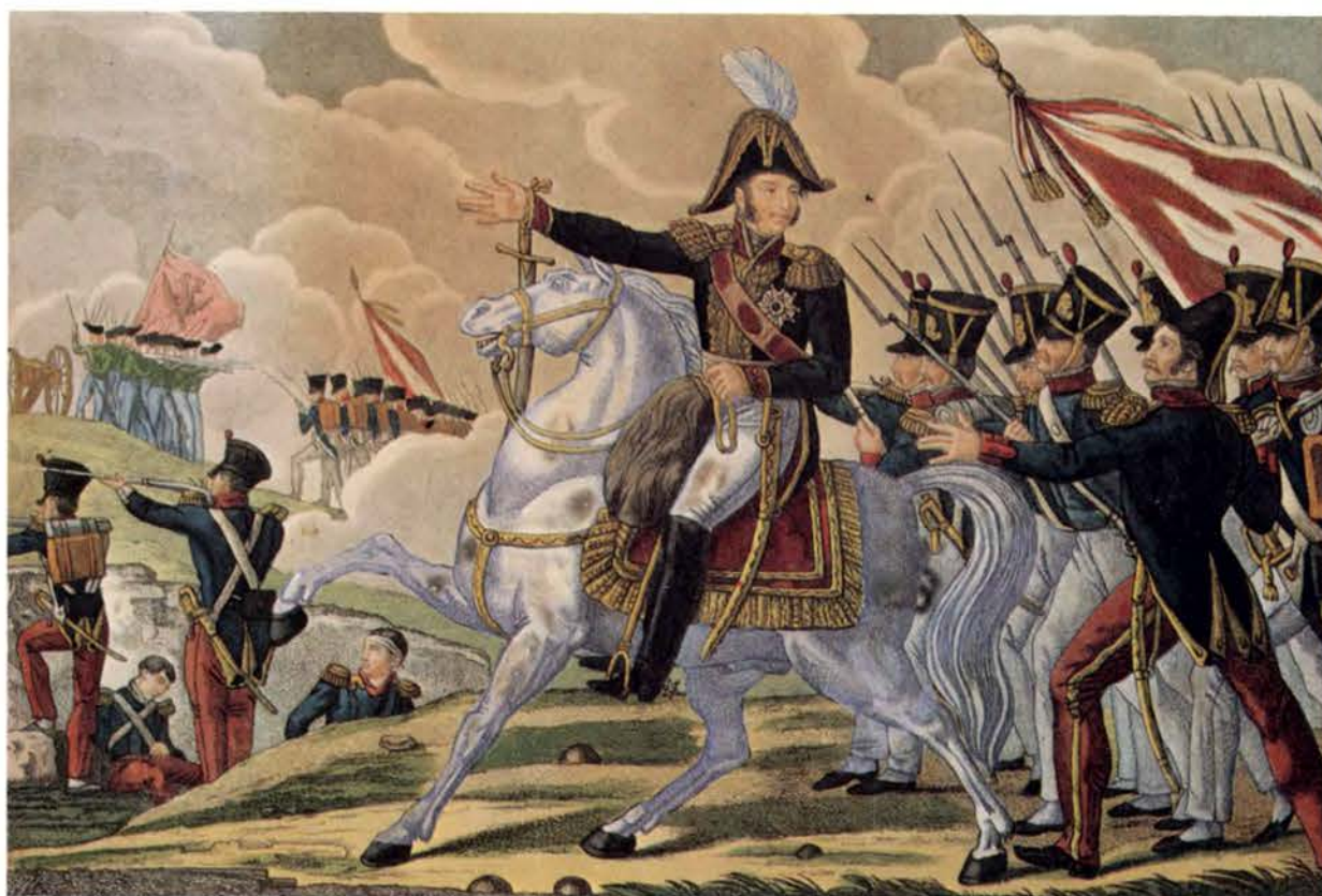
Атака корпуса Евгения Богарне на русские позиции у с. Бородина Раскрашенная гравюра неизвестного художника. 1-я половина XIX в.