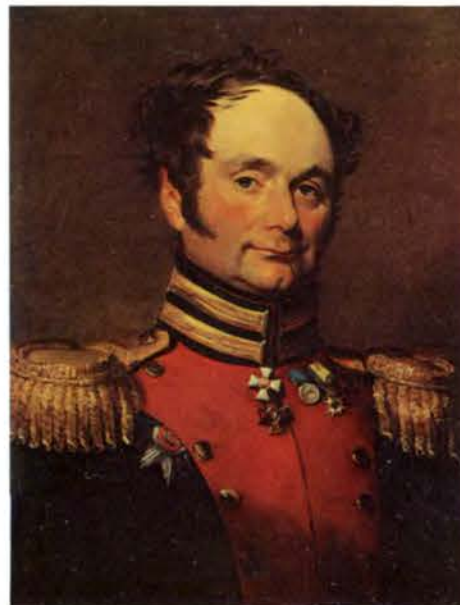
А. И. Бистром (1770 — 1828) Художник Д. Доу. 1820-е гг.