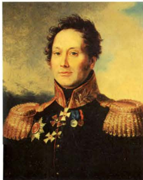
М. И. Карпенко (1775 — 1854) Художник Д. Доу. 1820-е гг.