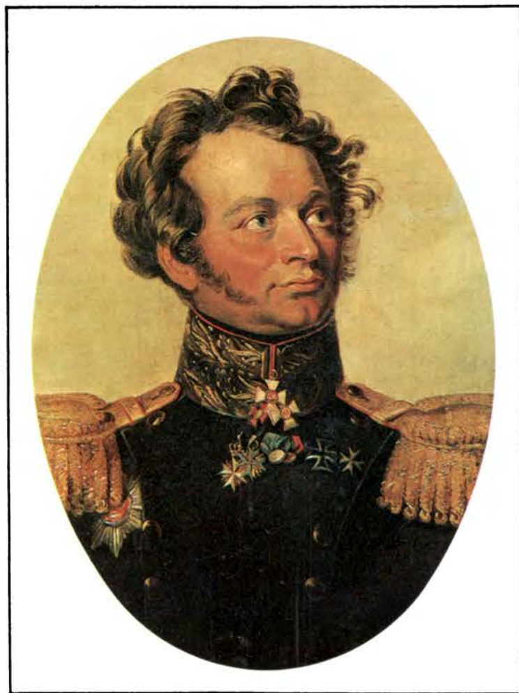
К. И. Бистром (1767 — 1838) Художник Д. Доу. 1820-е гг.

Почти одновременно на левом фланге наполеоновской армии части 4-го корпуса Богарне устремились в атаку на село Бородино, которое оборонял лейб-гвардии Егерский полк под командованием полковника К. И. Бистрома. Неподалеку, около моста через реку Колочу, находилась специальная команда матросов Гвардейского экипажа. Этот экипаж был создан весной 1810 г. в Петербурге из придворной гребной и яхтенной команд. По «высочайшему повелению» от 5 марта 1812 г. он в полутысячном составе (четыре роты по 100 матросов в