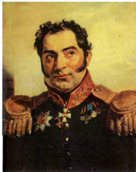
Н. В. Вуйч (1766 — 1836) Художник Д. Доу. 1825 г.