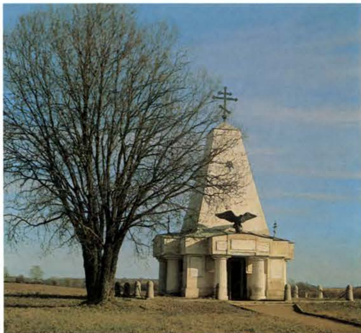
Памятник 1-му и 19-му егерским полкам на Бородинском поле Архитектор Б. Аль- берти. 1912 г.