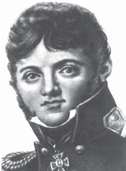
Юрий Федорович Лисянский