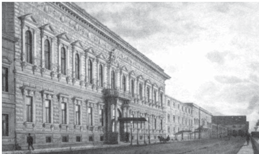
Дворец барона А. Л. Штиглица на Английской набережной. Акварель Альберта Н. Бенуа. Конец XIX в.