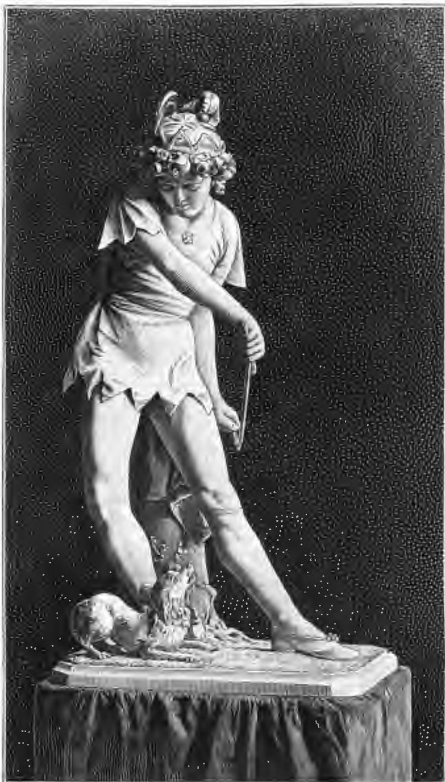
Весенняя выставка Имп. Анад. Худож. Дрессировщикъ. Группа изъ мрамора Г. Браге, грав. Флюгель.

жизнь проводить въ открытомъ морѣ, вѣчно плавая въ немъ, никогда не опускаясь для отдыха на слишкомъ далекое дно моря, никогда не приближаясь къ берегамъ его. Со всѣхъ сторонъ всегда окруженный только водою, многія изъ числа этихъ, такъ-называемыхъ пелagicкихъ животныхъ получили сходство съ нею, стали прозрачны какъ стекло и благодаря этой прозрачности получили возможность даже въ наиболѣе открытомъ мѣстѣ, окруженные исключительно водою, укрываться, становиться невидимыми для своихъ преслѣдователей. Такая совершенная прозрачность и безцвѣтность тѣла есть общій признакъ пелagicкихъ животныхъ и замѣчается у формъ принадлежащихъ къ самымъ различнымъ классамъ. Таковыми представляются напр. медузы или авалефы, которыя бывають иногда столь прозрачны, что, глядя въ упоръ на такое животное, долго не замѣчаешь его, несмотря на его значительную величину.