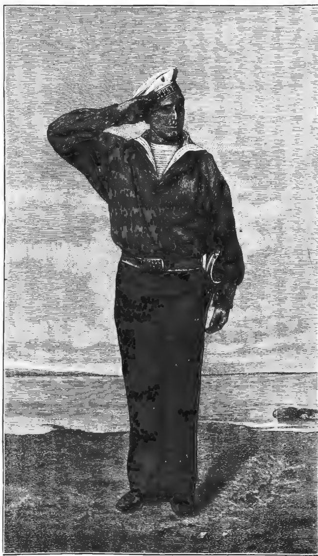
Весенняя выставка Имп. Анад. Худож. Матросъ. Акварель Д. А. Бенндорфа (собств. Е. И. В. Вел. Кн. Алексѣя Александровича), грав. Флюгель.

Тогда какъ животныя, обитающія на поверхности моря, принимаютъ окраску пѣны его волпъ,—животныя живущія подъ поверхностью его, приспособляются инымъ образомъ для того, чтобы сдѣлаться по возможности мало замѣтными и такимъ образомъ либо укрыться отъ своихъ враговъ, либо подстеречь жертву. Есть много морскихъ животныхъ, которыя всю свою